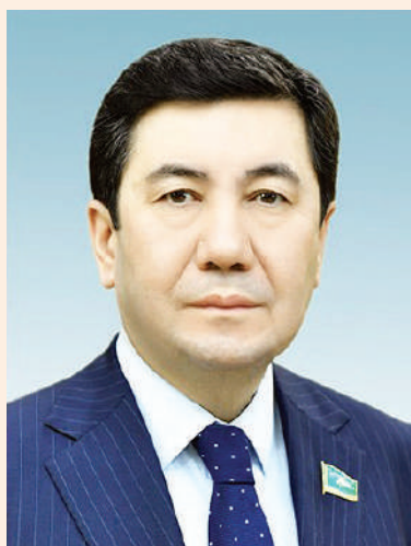
Ерлан ҚОШАНОВ, Мәжіліс Төрағасы: