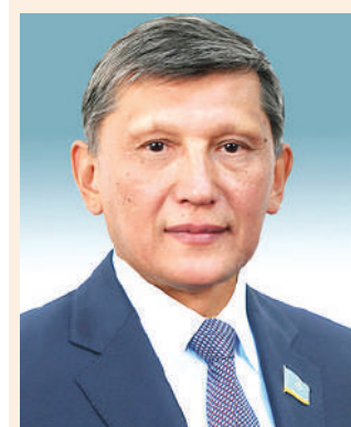
Нұрғөре ЖҮСІП, Сенаттың Әлеуметтік-мәдени даму және ғылым комитетінің төрағасы:

Ал біздің мақсатымыз — Жолдауда айтылған міндеттердің барлығын заңнамалық деңгейде сапалы әрі жедел орындалуын қамтамасыз ету.